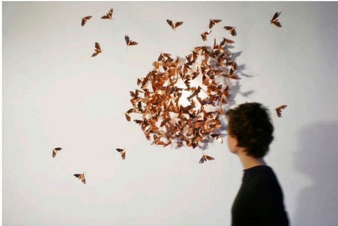
Mischer' Traxler Limited Moths, 2008