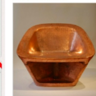
2000 года, Сибирь

Медь имеет богатую историю, и она идеально подходит для создания предметов домашнего декора. Медь имеет антибактериальные свойства, что делает ее идеальным материалом для посуды и мебели.