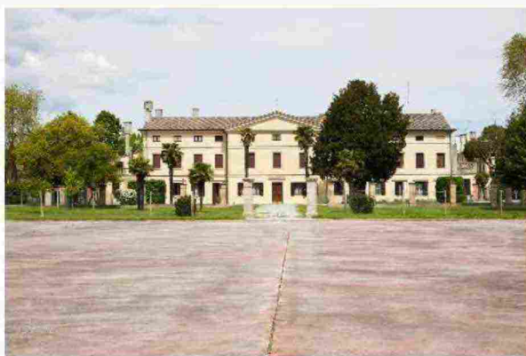
Alcune immagini della tenuta di Ca' Corniani AGOSTINO OSIO