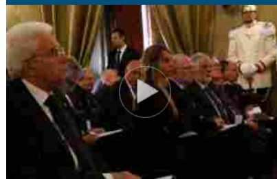
Presidente Lincei: con G7 Accademie anno intenso e soddisfacente