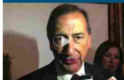
Radio Italia live, Sala: numero chiuso dispiace, ma fase delicata