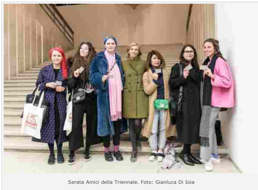
Serata Amici della Triennale.

Un tempio della creatività contemporanea, dove architettura, design, arte e moda dialogano fra loro. Il successo della Triennale di Milano dimostra come per un'istituzione museale la ricetta vincente sia il connubio fra rigore scientifico e nuove forme di finanziamento privato, con un'attenzione particolare per le generazioni future.