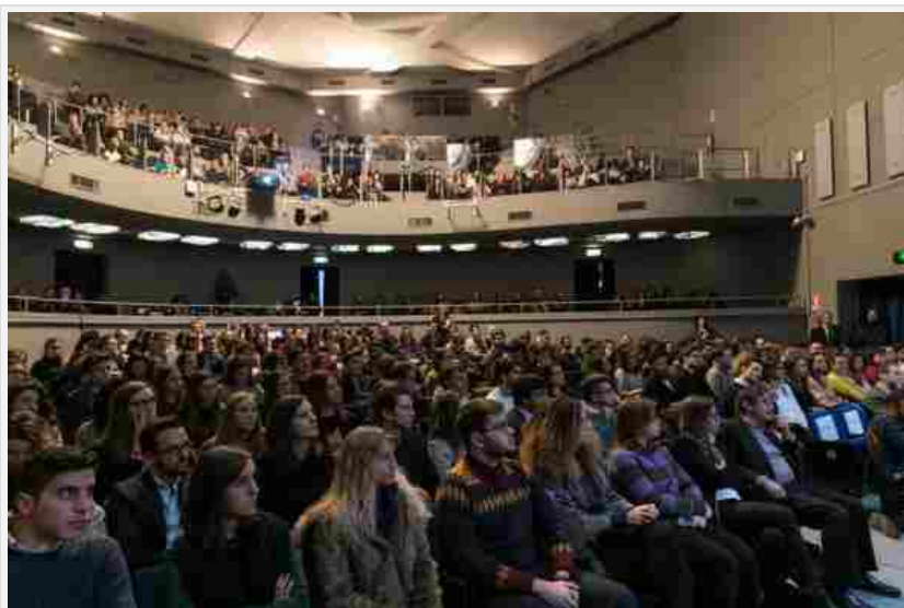
Serata Amici della Triennale.

http://www.triennale.org/sostieni/amici-della-triennale/